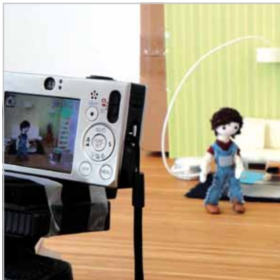
Stativ, Kamera und Kulisse